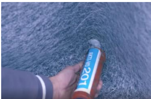
figura 01 – selamento das arestas

Posicionar o bico do aplicador próximo ao local a ser aplicado e aperte o gatilho em operação contínua de modo a preencher totalmente o local a ser selado. (modelos fig.01 e 02).