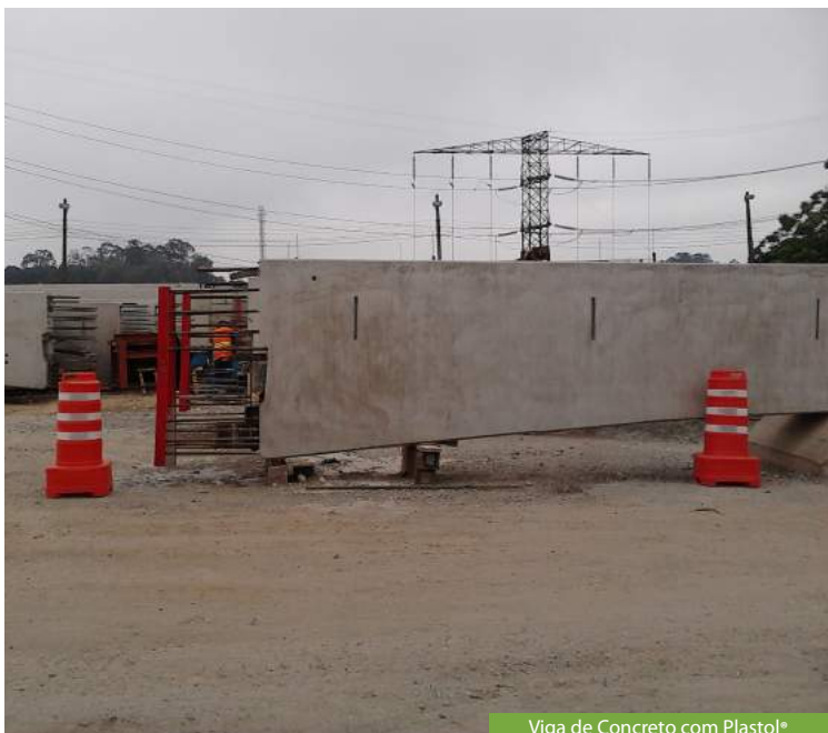
Viga de Concreto com Plastol®

É um aditivo redutor de bolhas de ar para concreto e argamassa de cimento Portland. É também utilizado para neutralizar a formação e incorporação de ar causado por alguns cimentos e superplastificantes.