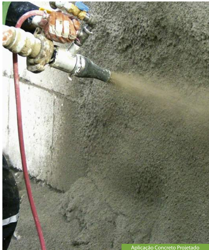
Aplicação Concreto Projetado