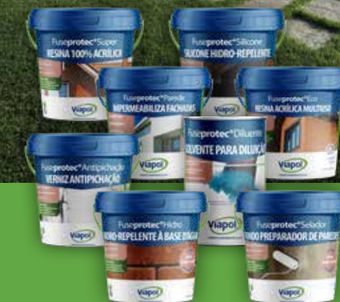
Linha completa de impermeabilizantes Fuseprotec®