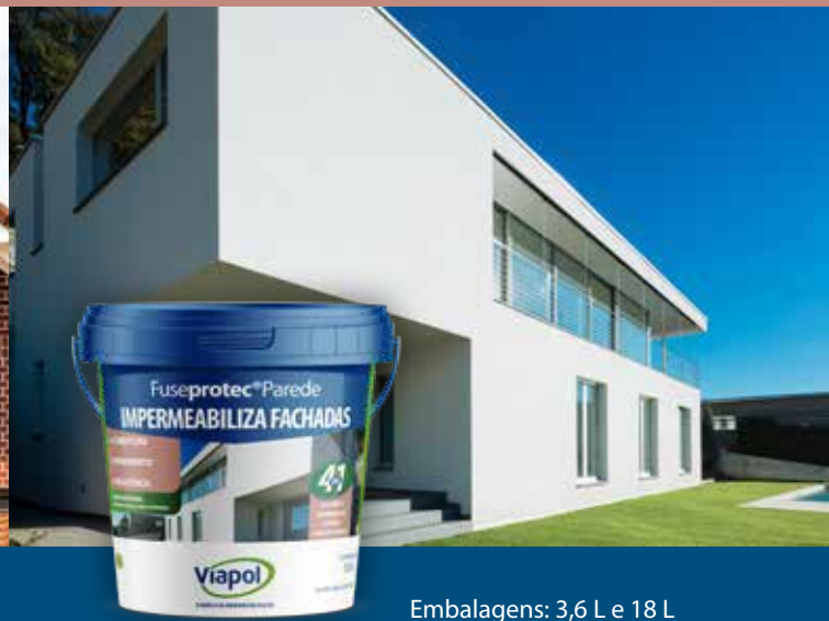
Embalagens: 3,6 L e 18 L