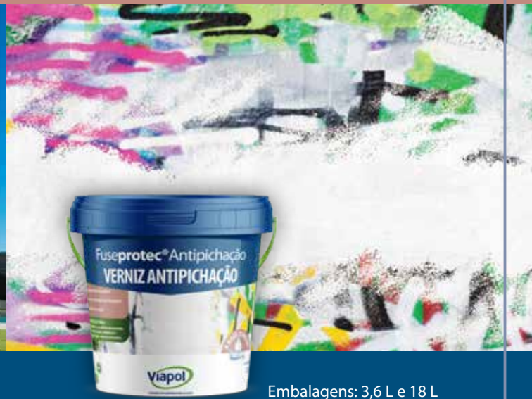
Embalagens: 3,6 L e 18 L