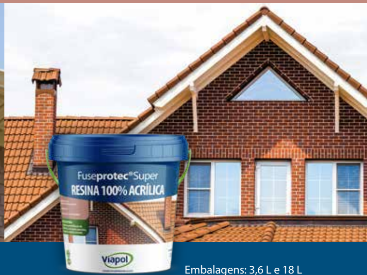
Embalagens: 3,6 L e 18 L